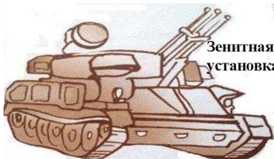
Зенитная самоходная установка