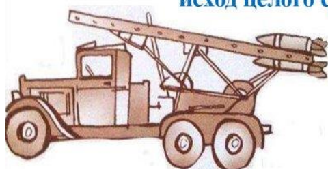
Установка реактивной артиллерии «Катюша»

Во время войны не раз бывало, что одно меткое артиллерийское попадание решало исход целого сражения